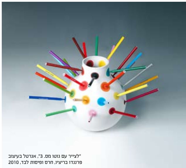
"לצייר עם גוטו מס. 3", אגרטל בעיצוב פרננדו בריציו, חרס ופיסות לבד, 2010

השיח על עיצוב ואמנות לא מעניין את דידייה, שכן ההבחנה בין שני התחומים ברורה לו, קבועה וסכמטית. הוא עצמו מייצג אך ורק מעצבים. לא אמנים היוצרים עיצוב, לא אדריכלים; רק מעצבים. אחת ממטרותיו היא להפריד עיצוב מאופנה. הוא לא עוסק באופנות חולפות והדיבור אודות טרנדים ממנו והלאה