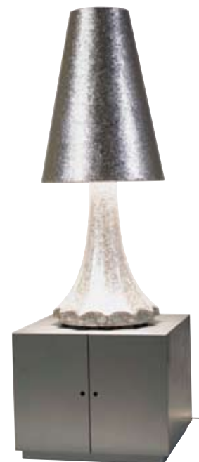
מנורה בעיצוב אלסנדרו מנדיני, עשויה פסיפס מזהב בעבודת יד, 2011