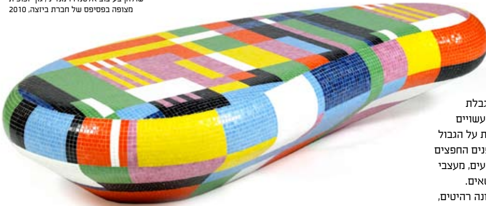
שולחן בעיצוב אלסנדרו מנדיני, גוף זכוכית מצופה בפסיפס של חברת ביזצה, 2010

השיח על עיצוב ואמנות לא מעניין את דידייה, שכן ההבחנה בין שני התחומים ברורה לו, קבועה וסכמטית. הוא עצמו מייצג אך ורק מעצבים. לא אמנים היוצרים עיצוב, לא אדריכלים; רק מעצבים. אחת ממטרותיו היא להפריד עיצוב מאופנה. הוא לא עוסק באופנות חולפות והדיבור אודות טרנדים ממנו והלאה