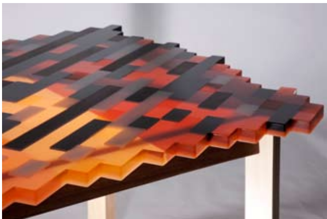
שולחן "תאורת יום" בעיצוב הלה יונגריוס, 2011